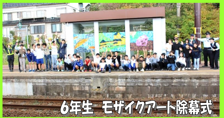
6年生 モザイクアート除幕式