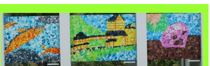
6年生が描いたモザイクアートが、温海を訪れた方々をお迎えます。