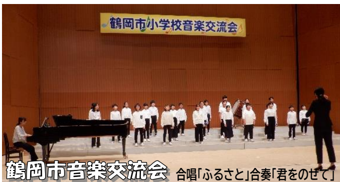
鶴岡市小学校音楽交流会