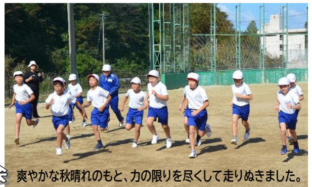
爽やかな秋晴れのもと、力の限りを尽くして走りぬぎました。