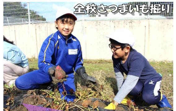
全校さつまいも掘り

今年も笠木小学校から苗をいただきました。猛暑に負けず育ったさつまいもを交流学年で収穫しました。