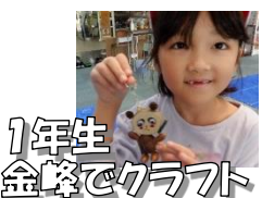
1年生 金峰でクラフト