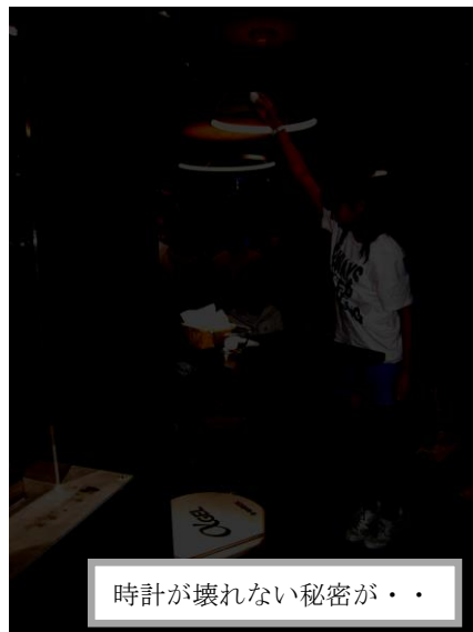
時計が壊れない秘密が・・・