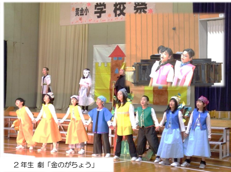
2年生 劇「金のがちょう」