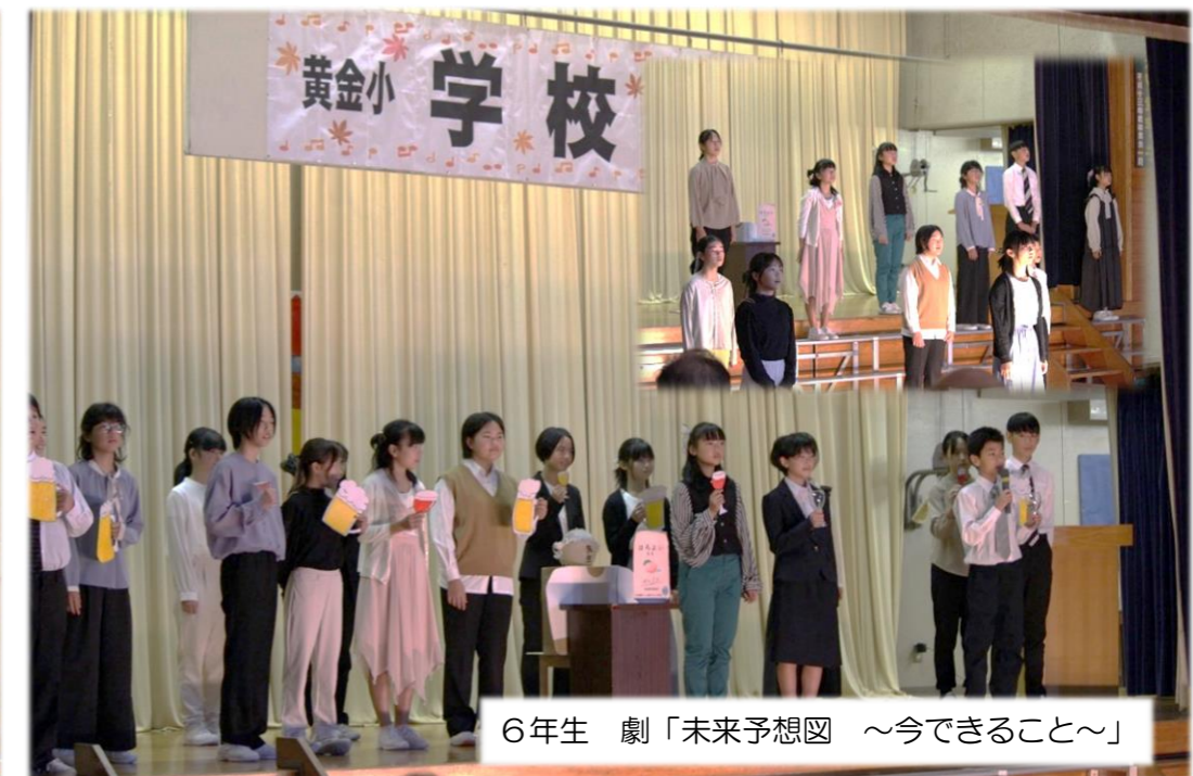
6年生 劇「未来予想図 ～今できること～」