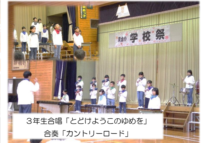
3年生合唱「とどけようこのゆめを」 合奏「カントリーロード」