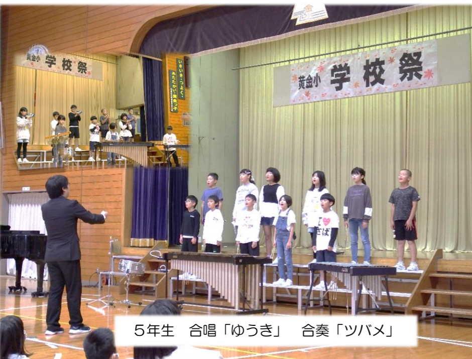
5年生 合唱「ゆうき」 合奏「ツバメ」