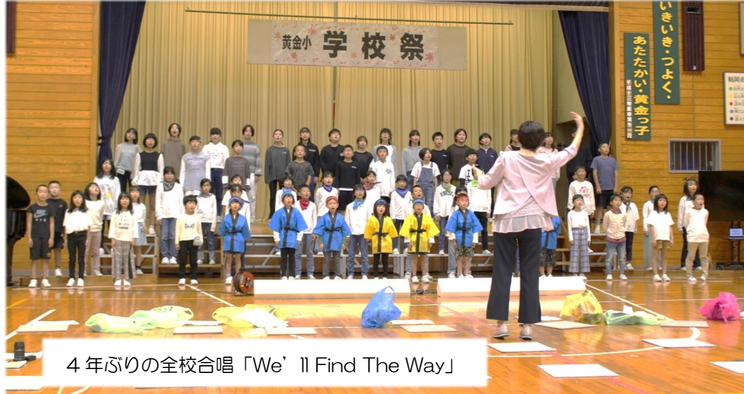
4年ぶりの全校合唱「We' ll Find The Way」