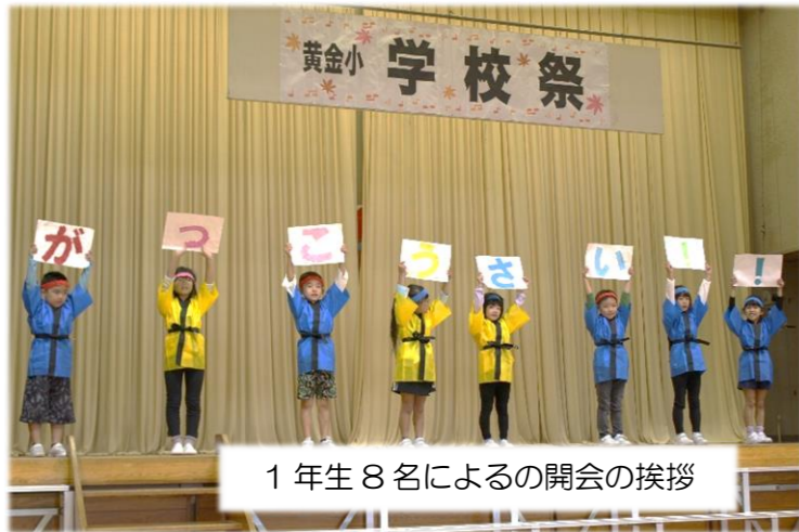
1年生 8名によるの開会の挨拶