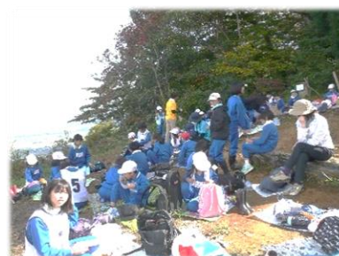
楽しくおいしいお弁当