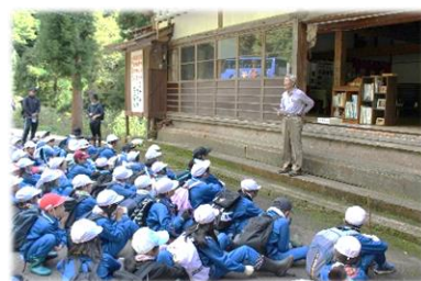
中の宮で“水”のお話し