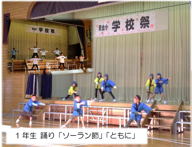
1年生 踊り「ソーラン節」「ともに」