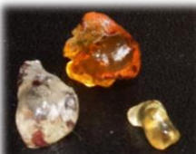
樹液の塊 HPでカラー版をご覧ください

晴れ渡った空に、新緑の木々。すがすがしさを感じる季節になりました。登校中に子ども達は様々なものを手にして学校に来る日があります。季節によっても変わりますが今は「草花」が多いです。ある日「校長先生、これあげる。」見ると、ムラサキツメクサー輪でした。今は校長室の小鉢に浮いています。またある日の昼休み、桜の木の周りで過ごしていた時のことです。樹液がしたたっているのを見て「宝石みたい!」と呟いていました。見ると琥珀色、黄色、透明…様々な色や形の樹液の塊がありました。「こっちにもあるよ。」「こっちにも!」固まった樹液を剥がしては見せ合って楽しむことができました。何気ない子ども達の言動に黄金地区の“今”の季節を感じています。