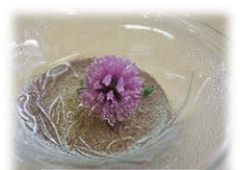
ムラサキツメクサ