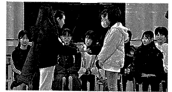
6年生からのバトン