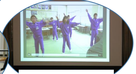
各学年のビデオ発表。