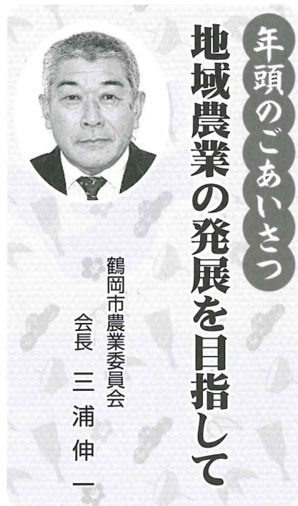
鶴岡市農業委員会