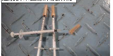
注射針※医療系廃棄物