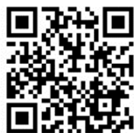
リサイクルプラザ