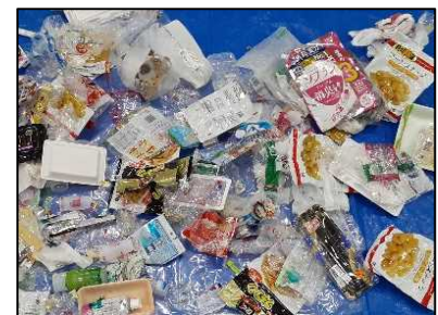
資源化できるプラ製容器包装類