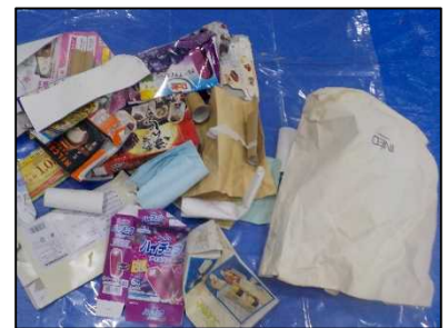
資源化できる古紙類