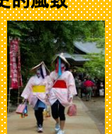
天満宮と編み笠の化けもの

鶴岡天満宮の信仰から形を変え市民の祭りとなった天神祭は、鶴岡天満宮などの歴史的建造物を背景に、老若男女が長襦袢に編み笠の化けもの姿、無言で見物者に酒を振舞い、パレードとともに練り歩く風習が継承されている。