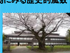
松ヶ岡開墾場 1番蚕室

戊辰戦争後に旧庄内藩士の手により開墾された松ヶ岡開墾場には蚕室群が残され、蚕室や本陣などの歴史的建造物を背景に、地域住民の総出作業が行われ開墾当時の精神が継承されている。