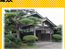
羽前絹練株式会社

旧庄内藩士により松ヶ岡で始まった桑栽培と養蚕・製糸。明治時代の一大産業となった絹産業の工場で昔の面影を残す羽前絹練と松ヶ岡開墾場内の歴史的建造物を背景に、絹を取り巻く営みは、人々の手により継承されている。