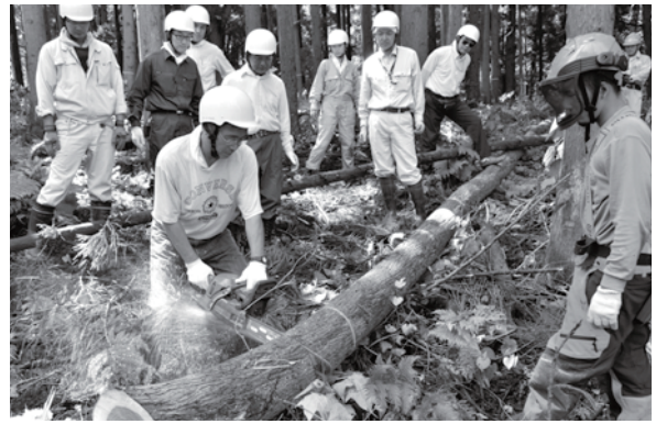
< 鼠ヶ関地区 >

400年もの歴史があり、今もなお継承されている御獅子舞。今年も夏の例祭で、激しく勇壮な踊りが奉納されました。