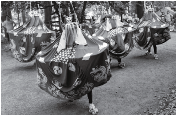
< 添川両所神社 >