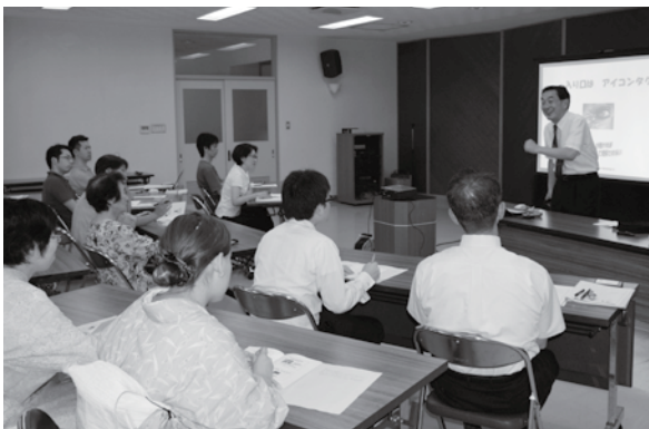
< 出羽商工会温海支所会館 >

森林に入る機会の少ない参加者が、間伐作業等を通して林業を体験。森林活動に関心を持つきっかけとなったようです。