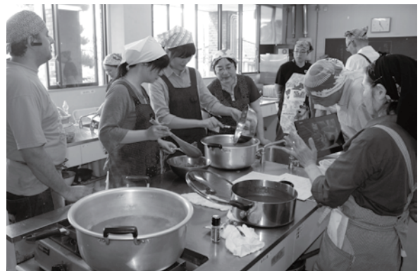
< 藤島地区地域活動センター >

「スタッフの主体的な働きようと気付きが大切です」。(株)JTB総合研究所から講師を招き、「おもてなしの心」を学びました。