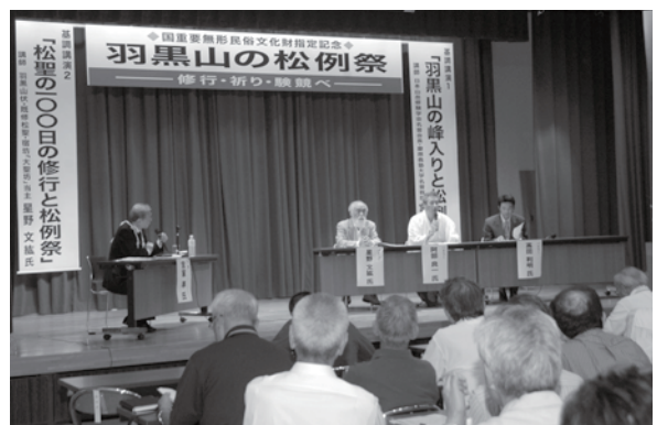
< いでは文化記念館 >

30年ぶりに行われたこの調査に住民らが参加。魚群探知機で魚影を確認し、伝説の巨大魚の存在に期待が膨らみました。