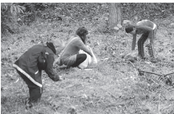
<月山あさひ博物村>

「あなたが知らない山が、きっとある」をテーマにトレッキング。参加者はマタギの里山暮らしの話に興味津々です。