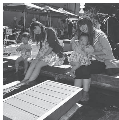
<あつみ温泉葉月橋通り>