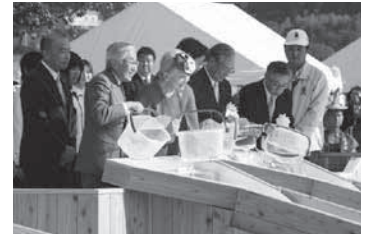
放流行事（第33回熊本大会）

※詳しくは、山形県ホームページ「第36回全国豊かな海づくり大会」をご覧ください。