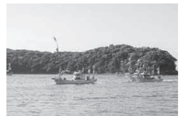
海上歓迎行事（第33回熊本大会）