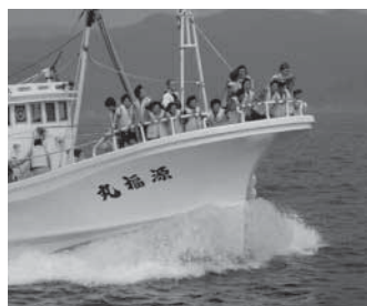
◀鼠ヶ関漁船クルージング 底引き網漁で使用する漁船に乗り込み、夏の日本海を爽快にクルージング。夕方出港のクルージングでは、日本海に沈む美しい夕日をたんのうでできる