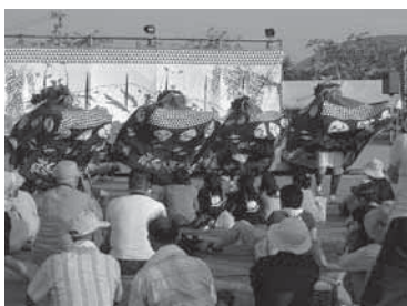
◀③鶴岡伝統芸能祭 獅子踊り、神楽、太鼓など各地域の伝統芸能を一堂に集めて行う芸能祭