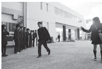
あいさつ運動 (4月8日～11日)

「無限の可能性」をスローガンに、これから1年間、生徒会は様々な活動をしていきます。意見しやすいように「目安箱」を設置しているのですが、できるだけ多くの声を取り入れていきたいです。また、6学科で開催する学校祭は今年が最後。生徒も地域の方も楽しめるものになりたいと気が入っています。学校生活は生徒会だけで成り立つものではないので、全校生徒で「より良い鶴工」をつくり上げていきたいと思っています。