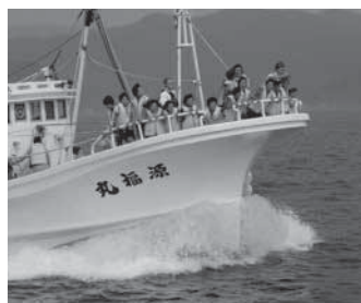
◀鼠ヶ関漁船クルージング 底引き網漁で使用する漁船に乗り込み、夏の日本海を爽快にクルージング。夕方出港のクルージングでは、日本海に沈む美しい夕日をたんのうでできる ☎あつみ観光協会 ☎43 - 3547

おもてなしプランを募集します 「観光バスや観光列車きらきらうえつを見掛けたら笑顔で手を振る」、「ごみが落ちていたら拾ってごみ箱に捨てる」、「記念撮影をしている人がいたらお手伝いする」など、自分たちがができる「おもてなしプラン」を募集します。 登録されたプランについては登録証を発行し、山形 DC のホームページ等で公開します。個人・団体・企業・学校で応募することができます。募集期間は九月十三日㊥までです。詳しくは、本所観光物産課へお問い合わせください。