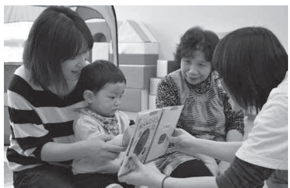
<会場：櫛引すこやかセンター>

朝日小学校と朝日大泉小学校が統合して開校したあさひ小学校。両校の伝統を引き継ぎ、新たな一歩を踏み出しました。