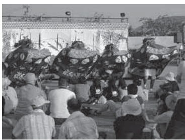
◀③鶴岡伝統芸能祭 獅子踊り、神楽、太鼓など各地域の伝統芸能を一堂に集めて行う芸能祭