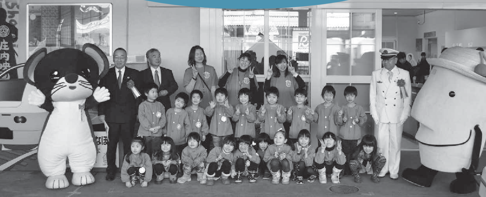
〈3月1日の鶴岡駅舎のリニューアルセレモニーで、駅に到着した観光客を温かく迎えてくれた大宝幼稚園の皆さん〉