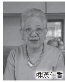
辰巳 芳子 氏 (株)茂仁香

日6月3日④午後2時 場いでは文化記念館 固200人 講演「いのちを繋ぐ食のあり方」 辰巳芳子氏 (料理家) 実演 煮干し、魚・豚・鶏の骨を使っただしとり方 チケット 2,000円 固チケット取扱い 出羽商工会本所・各支所 出羽商工会本所 ☎64・2130