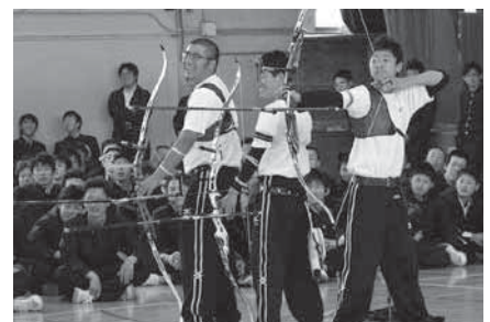
対面式・部活動紹介 (4月9日)

さんの声を記入し、郵便ポストに投函してください(切手不要)。頂いた意見等は担当課に回付し、回答文を差出人にお送りします。