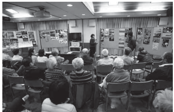
<会場：創造の森交流館>

今年度から5歳児の組が新設されたいずみ保育園。106人の園児たちが元気一杯に新たなスタートを切りました。