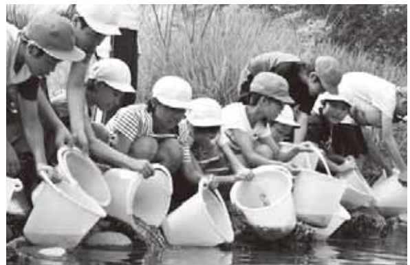
<櫛引地域東荒屋地区>

村上駅～酒田駅間で運行され、あつみ温泉駅と鶴岡駅に停車。ホームは多くの観光客や親子連れでにぎわいました。