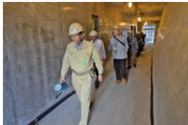
ホール脇通路を通りながら館内を探索