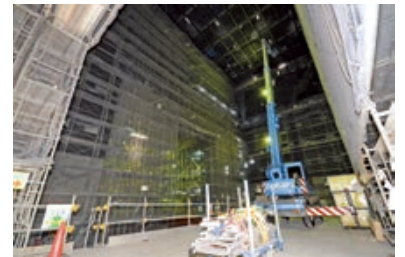
旧文化会館より広くなった舞台と舞台袖