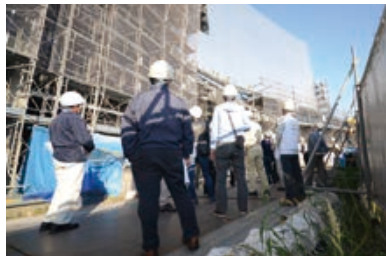
姿を現してきた外装