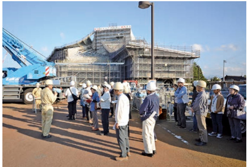
鶴岡アートフォーラム側から望む文化会館