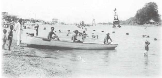
▲鼠ヶ関海水浴場(昭和前期頃)