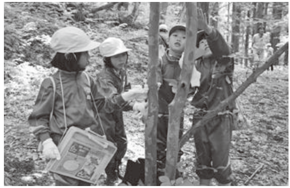
<森林公園生き活きべんとう村>

約2年間の工事を終え、黄金堂の一般公開が始まりました。秋には「於竹大日堂」とともに初の御開帳を予定しています。