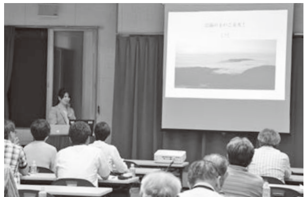
<手向地区地域活動センター>

川底で捕まえた生き物を手に取り、じっくりと観察し種類を判別します。びしょぬれで頑張る児童の姿も見られました。