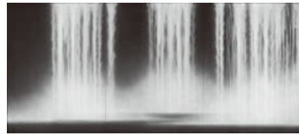
本どんちようのデザイン…千住博氏「水神」

定30人 因同館本どんちようを製作するための生糸用の秋蚕の飼育 ■ 飼育期間 9月初旬～中旬(飼育キット配布は9月1日④～3日④) 申 8月1日④～26日④に本所政策企画課 ☎内線525へ 他 市HP