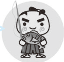
鶴岡市の魚クロダイPRキャラクター

当日は、400台分の駐車場を準備しますが、多くの方が利用できるよう、車でお越しの際は、乗り合わせてお越しください。ご協力をお願いします。