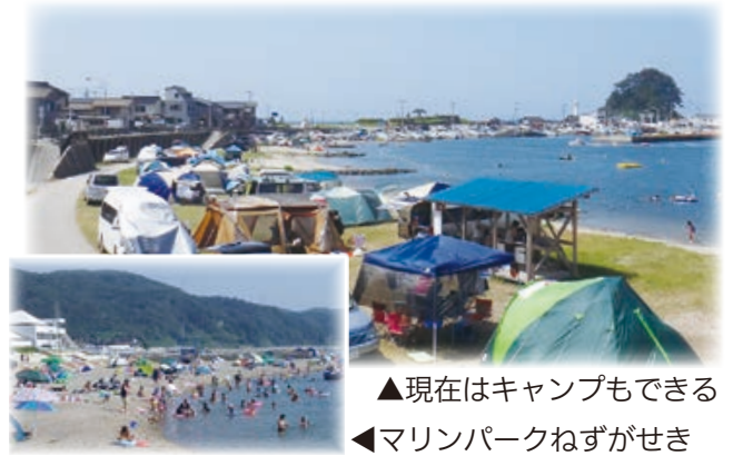
▲現在はキャンプもできる