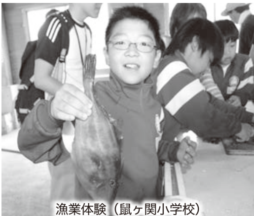
漁業体験 (鼠ヶ関小学校)

本市では、以前から森・川・海のつながりを大切にするため、海と、海を取り巻く環境の保全に市民や地域が丸となって取り組んできました。その一つが、平成九年に油戸地区で始まった「魚の森づくり事業」です。これは、海に流れ込む地下水や川の源流を豊かにするため、植栽や下草刈り等を行う活動で、現在は堅苔沢地区や鼠ヶ関地区にも広がっています。 また、子供たちの海・川・魚への理