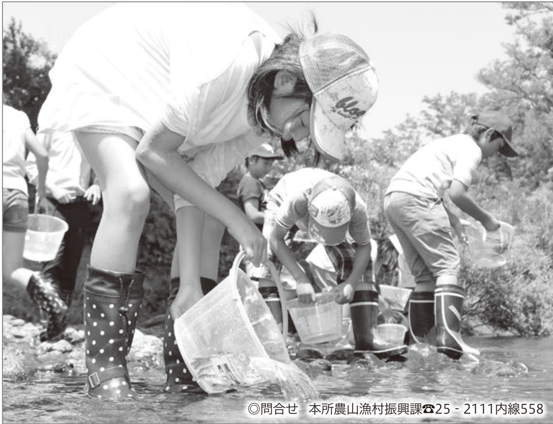
©問合せ 本所農山漁村振興課 ☎25 - 2111内線558