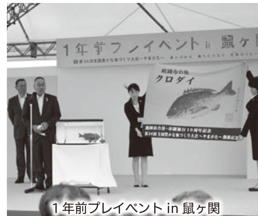
1年前プレイベント in 鼠ヶ関