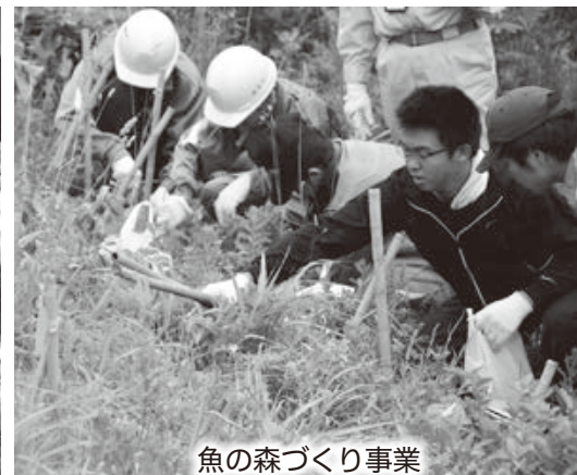
魚の森づくり事業