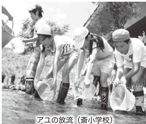
アユの放流 (斎小学校)