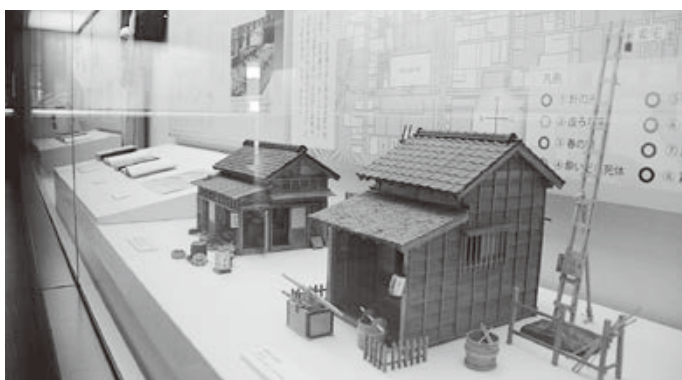
<朗読会：荘内神社参集殿 企画展：藤沢周平記念館>