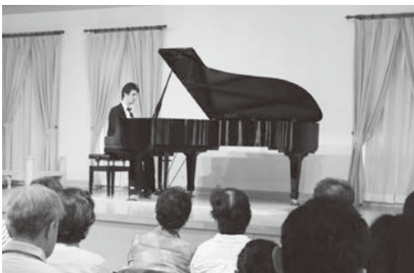
<東田川文化記念館>

日本遺産の認定を受けた出羽三山の歴史と文化。参加者は日本遺産認定の意義や門前町・手向地区の魅力を学びました。