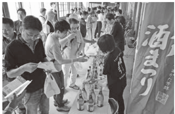
<JA全農山形鶴岡倉庫、マリカ西館周辺>

初夏の爽やかな風が吹く中、『幻想即興曲』『練習曲(別れの曲)』など数々のショパンの名曲が会場に響き渡りました。