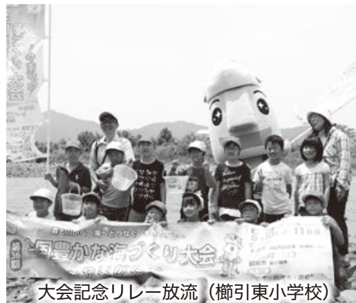
大会記念リレー放流（櫛引東小学校）