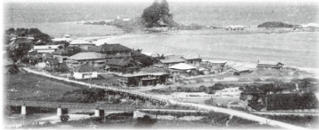
▲弁天島遠景(昭和前期頃)