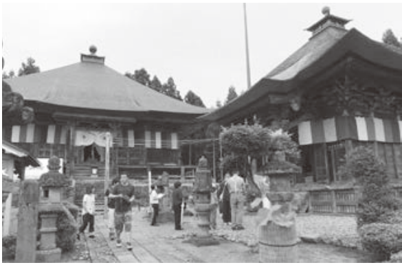
<羽黒山正善院黄金堂>