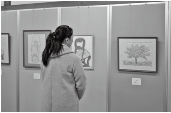
<東田川文化記念館>