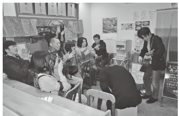
<あつみ温泉朝市広場ほか>

「入学おめでとう」。優しい声に乗せて新入学の児童たちに反射材やチラシを配り、交通安全を呼び掛けました。