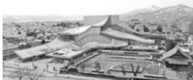
改築工事現場全景（3月現在）