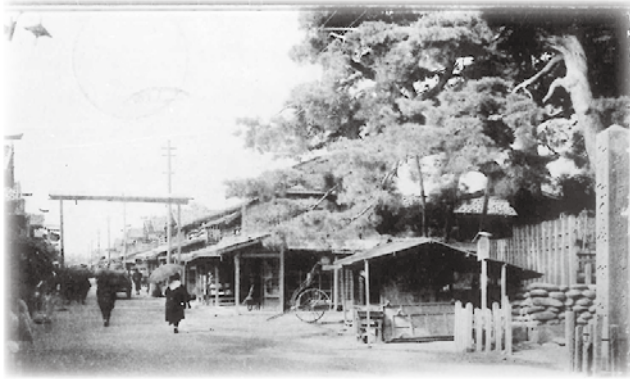
▲大正期の荒町（山王日枝神社前から）