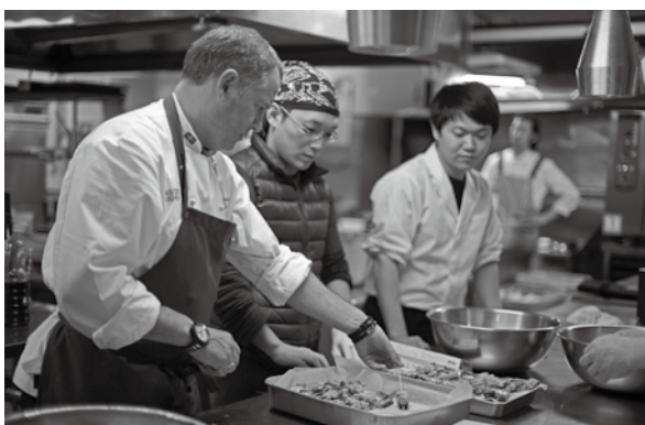
<グランドエル・サン>

はじめ、オーガニックマルシェや羽黒高校吹奏楽部のコンサート、人力車でのお花見等が催され、会場には来場者の笑顔があふれていました。