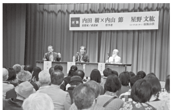
<いでは文化記念館>

東日本よりすぐりの自然や文化に触れる旅を提供する列車が来鶴。約1,200人の市民等が集まり、乗客を歓迎しました。