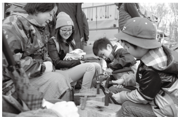
<小真木原運動公園>

スペインのビルバオ市から3人のシェフが来鶴。同市へ派遣された本市の料理人と考案した創作料理が振る舞われました。