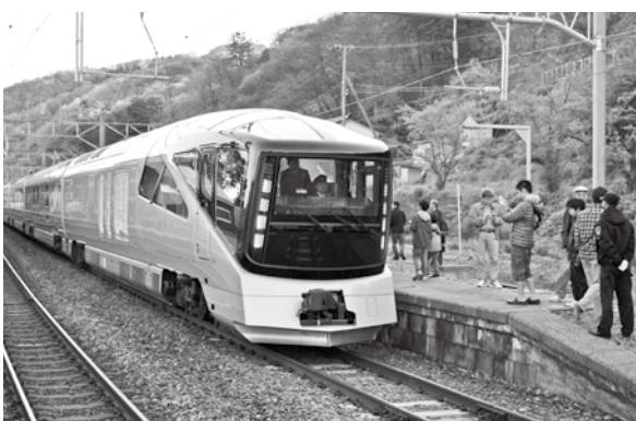
<写真：あつみ温泉駅>

同地区の子供から大人までが参加する例大祭。100人を超える行列が、ほら貝や大太鼓を鳴らしながら練り歩きました。