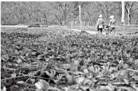
<下田沢かたくり園>

高校生が中心となり県内5か所で開催。大会の見所紹介や地元高校音楽部等の発表を通し、開幕への機運を高めました。