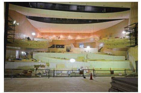
大ホールの施工状況／6月2日撮影