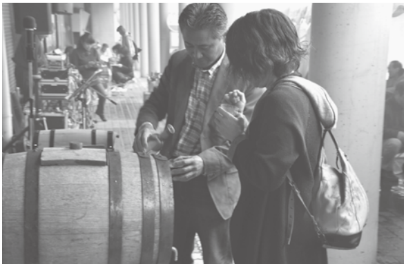
<月山あさひ博物村>