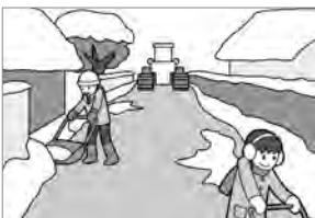
⑦除雪車通過後の雪の片付けはお互いに協力して行いましょう