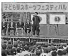
オープニングセレモニーの様子 (10月8日/小真木原公園)

自分の選手時代を振り返ると、本当に悔いのない日々だったなと思います。周りの人々や環境に恵まれ、大好きな卓球に打ち込むことができました。卓球に限らず、スポーツをする子供たちには、好きなことに取り組める幸せに気付いてほしいです。その時間を大切に、スポーツを楽しんでもらえたらうれしいですね。