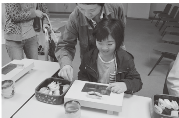
<小真木原総合体育館>

シンポジウム、食べ歩き、スポーツイベント、ファッションショー、子供の遊びの広場など多彩な催しが行われ多くの方が訪れました。