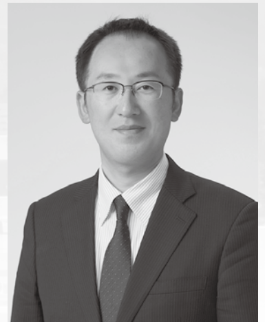
鶴岡市長 皆川 治