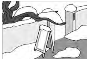
②道路にはみ出した枝や植木、看板等は撤去しましょう