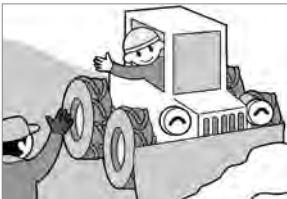
①除雪車にあつたら道を譲りましょう