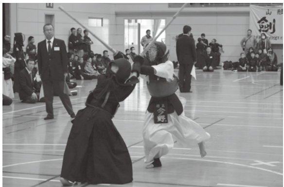
<櫛引スポーツセンター>

絵画、写真、書道、生け花、手工芸品等約700点を展示。いずれも力作ぞろいで会場を訪れた人たちを楽しませました。