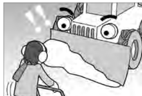
④危険！作業中は除雪車に近寄らないようにしましょう