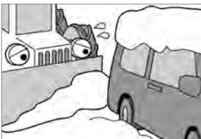
③除雪の妨げになる路上駐車は絶対にやめましょう