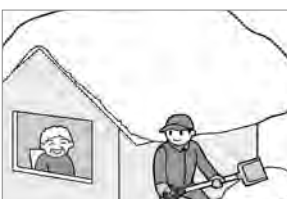
⑨高齢者世帯・母子世帯等、除雪に困っている方には近所で協力しましょう