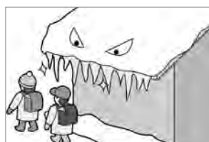
⑩屋根の雪や、通学路・道路に面したつらは早目にとりましょう