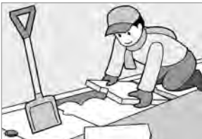
⑤雪捨てで側溝の蓋を外したら、作業後は必ず元通りに閉めましょう