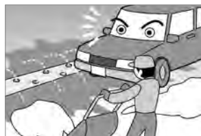
⑧道路への雪の排出はやめましょう（消雪道路も）