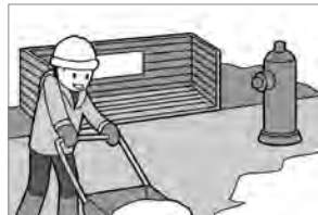
⑥消火栓、ゴミステーションの前の除雪は町内で協力して行いましょう