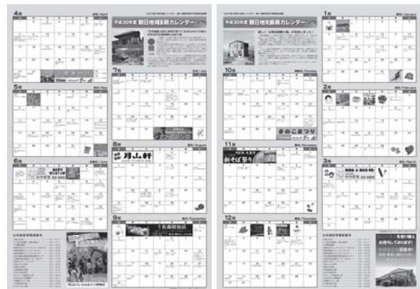
平成30年度同カレンダー

他広告掲載の決定後、指定する期日まで広告原稿(電子データの場合はJPEG形式またはGIF形式。作成及び作成費用は広告主負担)を提出してください。詳細は市HPでご確認ください。