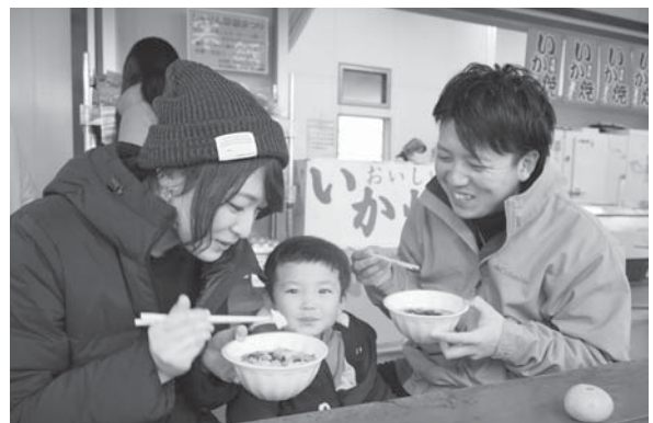
<道の駅「あつみ」しゃりん>

1.5 同館では初めての企画。市内団体が新年を祝い琴や尺八、バンド演奏、二胡、三味線、舞踊を披露し観客を楽しませました。