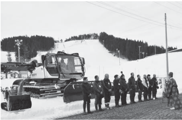
<櫛引たらのきだいスキー場>

12.13 高齢者が生きがいを感じながら、地域に密着した活動をしていることが認められ、優良老人クラブとして表彰されました。