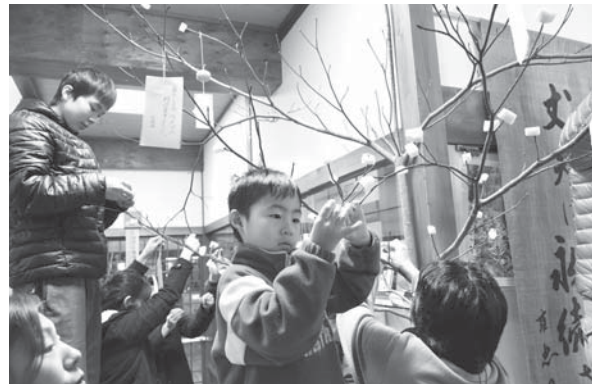
<関川しな織の里ぬくもり館>

12.22 関係者約30人が参加。圧雪車のおはらいなどが行われ、今シーズンのにぎわいと利用客や職員の安全を祈願しました。