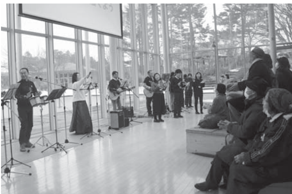
<鶴岡アートフォーラム>

12.30 「良い年になりますように」。子供たちが、お餅とみかん、願い事や目標などを記した短冊を鮮やかに飾り付けました。