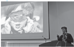
講演会の様子（昨年11月18日／出羽庄内国際村）

人が育つには自然現象や他の命などとの関係性が大切ですが、一番は人との関係性が大切です。吹雪の日に、冷え切った手をお母さんに包んでもらったときのぬくもり。そういった経験が成長に役立ってくる。変化に富んだ自然の中では、人との多様な関係性が生まれます。そういう環境があることで、人はより豊かに育つことができるのだと考えています。