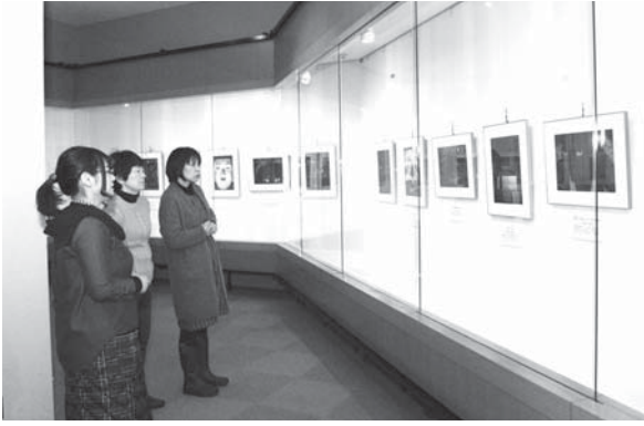
<いでは文化記念館>