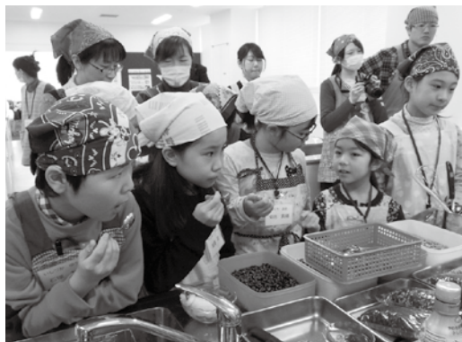
在来の豆を使った味覚のレッスン