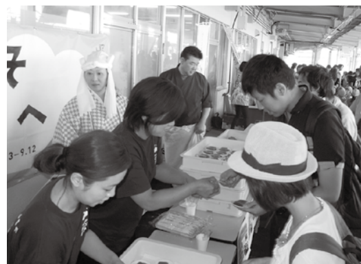
ミラノ万博に向けたPR(精進料理試食)