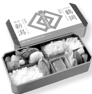
鶴岡市・新潟市 食の共演弁当

今後様々な分野の方や地域と協力しながら、継承と創造を通じて「食の理想郷・鶴岡」を発信し、地域活性化につながる取り組みを進めていきます。皆さんのご協力をお願いします。