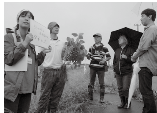
鶴岡ふうどガイド