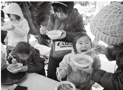
日本海寒鰯まつり

品種改良や水利事業の取り組みなど、生産者らの努力によって昔から良質の米が生産されてきた庄内平野。日本を代表する稲作地帯であり、現在のはつや姫、はえぬきなどの高品質米が生産されています。良い米と水に恵まれた本