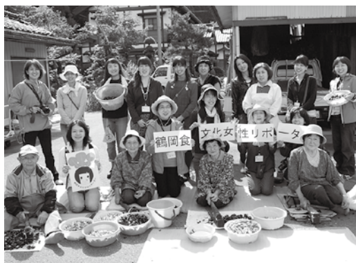
鶴岡食文化女性リポーター