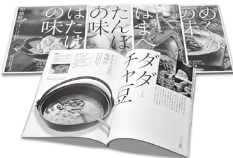
鶴岡の食文化を伝えるレシピ集