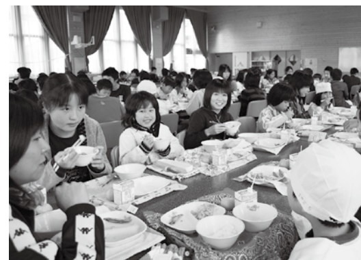
オール鶴岡産給食