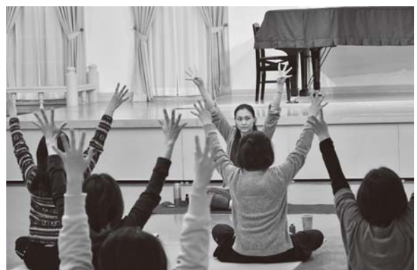
<東田川文化記念館>

鶴岡で起きたあだ討ちを鮮烈に描いた本作の魅力伝える企画展。実際に使われた刀は5月7日まで展示されます。