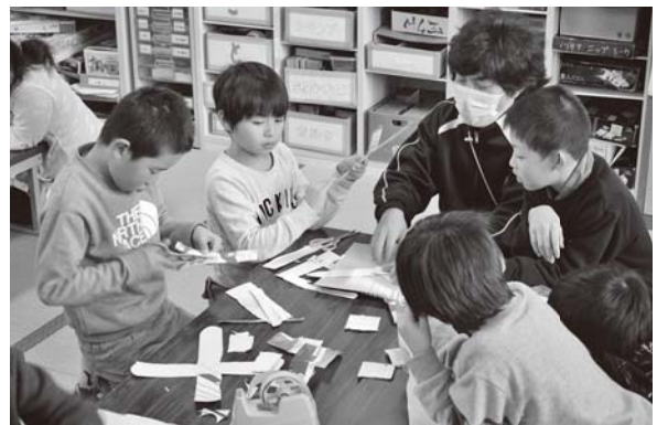
<榊引西学童保育所ほか>

昨年11月から本格的に掘削が始まった同現場を親子連れなど35人が見学。大型掘削機等の迫力に圧倒されていました。