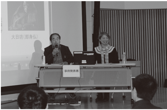
<先端研究産業支援センター>