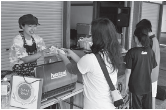
<あつみ温泉朝市広場>