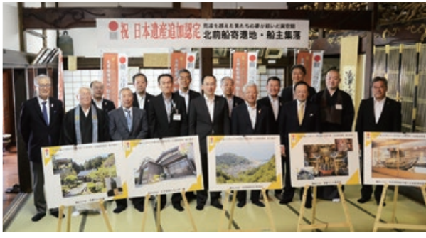
5月20日に追加認定され、同日、認定を祝う発表会が浄禅寺で行われました。

この度、日本遺産「荒波を越えた男たちの夢が紡いだ異空間」北前船寄港地・船主集落」に、本市を含む7つの自治体が追加認定されました。 「出羽三山生まれかわりの旅」「サムライゆかりのシルク」に次ぐ3件目の日本遺産認定。3つといるのは全国最多で5自治体のみ。東日本では唯一です。