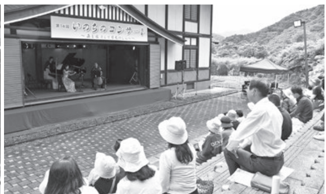
<月山あさひ博物村>