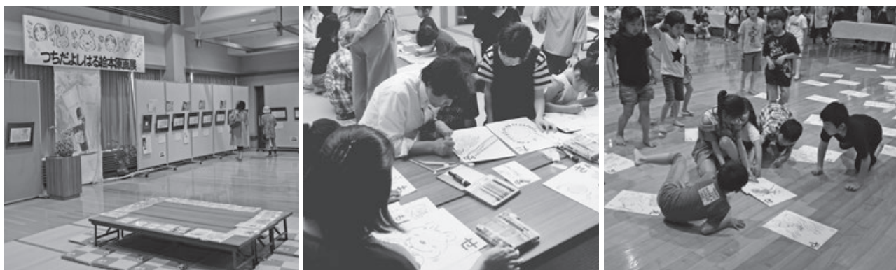
<黒川能の里王祇会館>

イズニーリゾートスペシャルパレード。「ミッキー!」。人気キャラクターたちが姿を見せると、沿道に大きな歓声が響き渡りました。