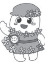
鶴岡市エコキャラ みどりちゃん

▼「クールチョイス」の例 ▽肌寒いときは1枚余分に着る ▽暖房は室温20度を目安に温度を調節する ▽丈の長い厚目のカーテンを使い、冷気の侵入を防ぐ ▽暖房機器や電気製品の不必要なつけっぱなしをしない ▽電気・ガス・石油機器等を買うときは省エネ性能の高いものを選ぶ ▽冷蔵庫内は季節に合わせて温度を調節し、物を詰め込み過ぎない ▽シャワーのお湯はこまめに止める ▽車の運転では、エコドライブを実践して燃費効率の向上を図る