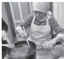
イベントの様子（昨年11月30日／農村センター）

ここ鶴岡は学校給食発祥の地ですね。それに食材が本当に豊富。皆さんには、地元のものをもっと食べて、全国の見本となるような食生活を送ってほしいです。おいしいものを作って食べて、笑顔になる食卓が増えていくことを願っています。