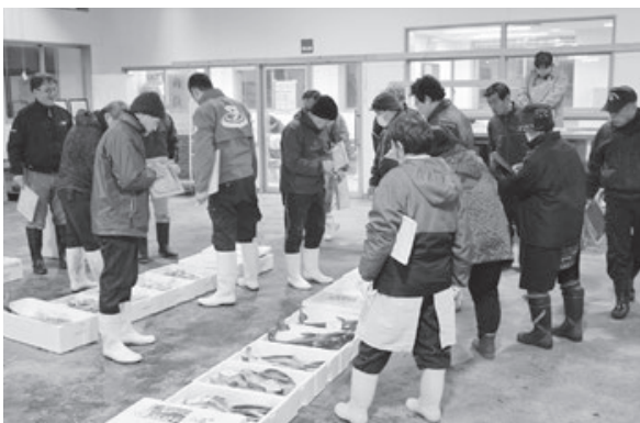
<山形県漁協念珠関地方卸売市場>

Uターン検討者などが参加し、鶴岡で多様な生き方をしている方々と起業・婚活・子育て等をテーマに語り合いました。