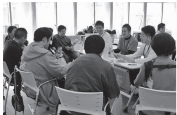
<先端研究産業支援センター>

イルミネーションを見に訪れた人たちをおもてなし。市内の小学生が考案した温かい飲み物を1日限りで提供しました。