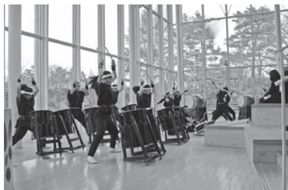
<鶴岡アートフォーラム>

実際に映画で使用された衣装や小道具などを展示。細部まで施された装飾を、間近でじっくりと見ることができます。