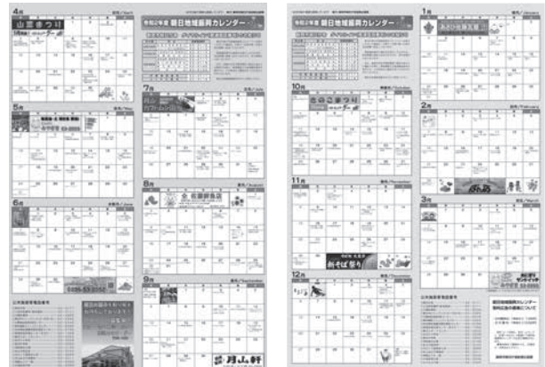
令和2年度同カレンダー

子データの場合はJPEG形式またはGIF形式。作成及びその費用は広告主負担）を提出してください。詳細は市HPでご確認ください。