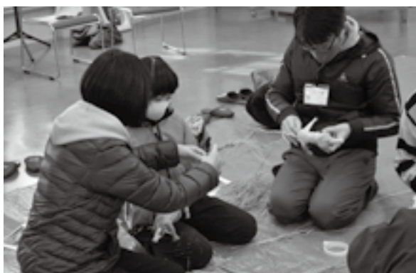
<東田川文化記念館>

1.24 青空が広がる絶好のコンディションの中で、自分のベストな滑りを目指して、果敢にコースに挑戦していました。