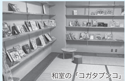
和室の「コガタブンコ」