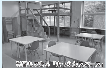
学習もできる「まったりスペース」