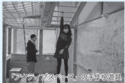
「アクティブスペース」の手作り遊具