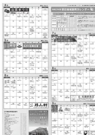
令和3年度同カレンダー（表面）

稿（電子データの場合はJPEG形式またはGIF形式。作成及びその費用は広告主負担）を提出してください。市HP