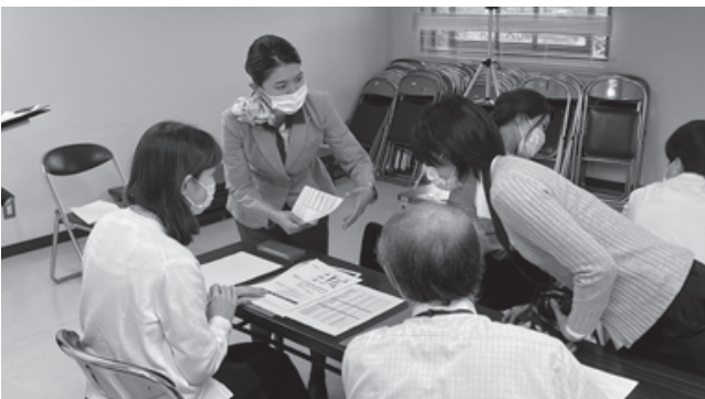
▲市の職員を対象とした接客研修。客室乗務員としての経験を生かし、接客対応の心掛けなどをアドバイスしました。