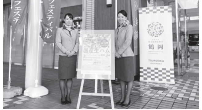
▲ユネスコ食文化創造都市情報発信強化業務の一環で、市内で開催される食に関するイベントに参画しています。