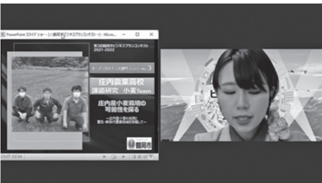
▲昨年度の鶴岡市ビジネスプランコンテストでは、参加校でのサポートや最終審査会当日の司会進行を務めました。