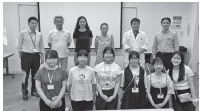
▲市と昭和女子大学の包括連携協定に基づく「地域協働インターンシップ」では、アドバイザーとして調査活動などに協力。

ブルーアンバサダーの活動が始まって1年。市では、この取り組みを進めるANAあきんど(株)庄内支店と連携し、各種事業でブルーアンバサダーと協働しています。 昨年度は、「おいしいつるおか！産直フェア」の会場となった産直施設での、鶴岡産農林水産物の販売促進や、食文化情報発信強化のために、食に関するイベントへの参画などに取り組んでもらいました。また、婚活促進事業での男性に対するマナー講座の講師や、鶴岡市ビジネスプランコンテストでは、市内教育機関でのプラン作成サポートをはじめ、最終審査会での司会進行も務めてもら