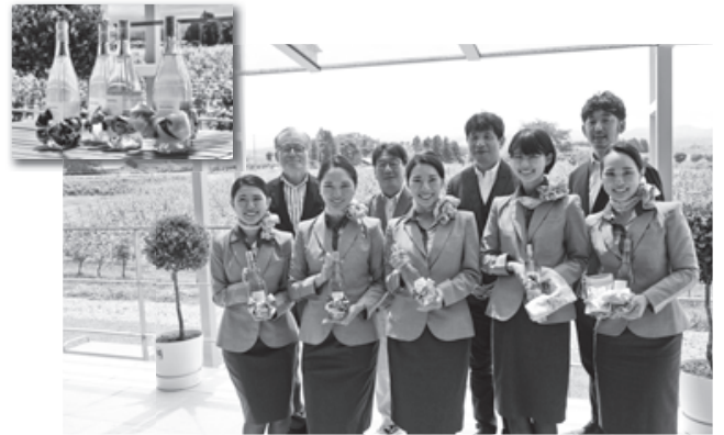
▲民間企業と協働する「松ヶ岡ワイナプロジェクト」では、完成したワインを、市のふるさと納税返礼品として活用。