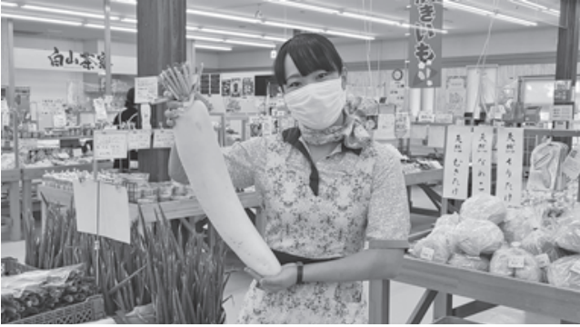
▲「おいしいつるおか！産直フェア」の会場となった市内産直施設で、鶴岡産農産物のPRを実施。