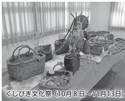
くしびき文化祭 (10月8日~11月13日)