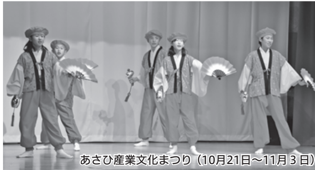
あさひ産業文化まつり (10月21日~11月3日)