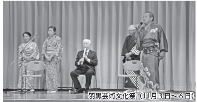
羽黒芸術文化祭 (11月3日~6日)