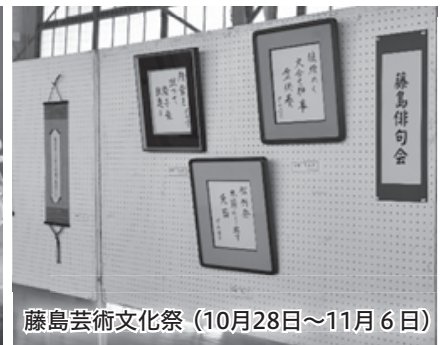
藤島芸術文化祭 (10月28日~11月6日)

芸能発表や、手工芸品・俳句などの作品展示が各地域で行われ、多くの人々が芸術の秋を楽しみました。あさひ産業文化まつりでは、小・中学生が鮮やかな衣装を着て「大黒舞」を披露すると、来場者から盛大な拍手