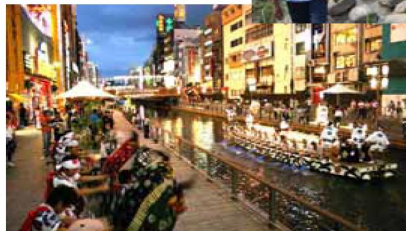
イベント・オープンカフェ利用(道頓堀川)