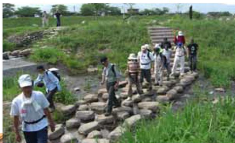
河川を核とした地域活性化(最上川)