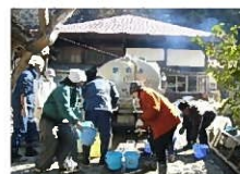
災害時における 応急給水の状況