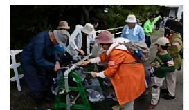
住民参加による 応急給水訓練