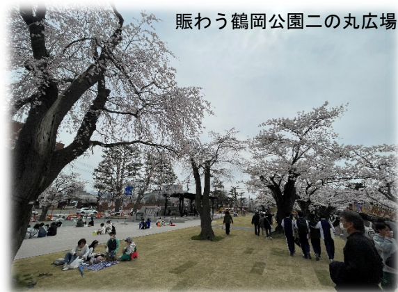
賑わう鶴岡公園二の丸広場