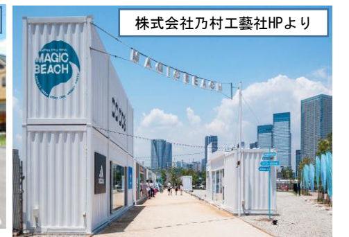
株式会社乃村工芸社HPより