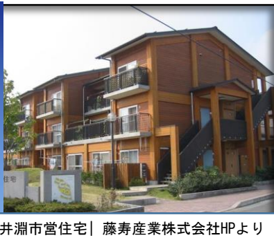
金井淵市営住宅