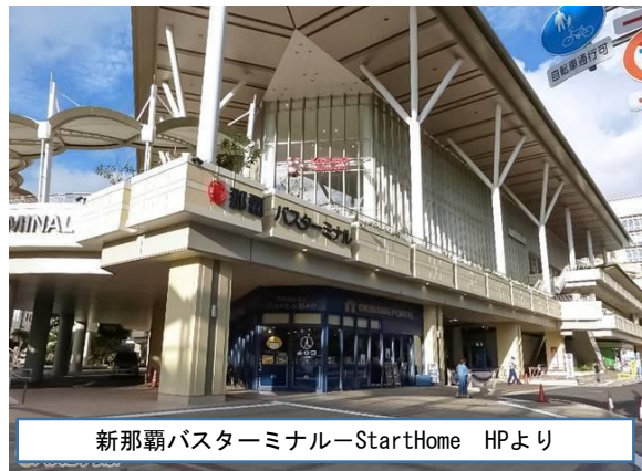
新那覇バスターミナル