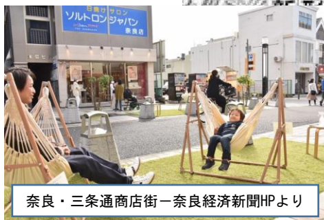
奈良・三条通商店街