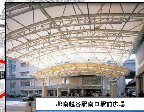
JR南越谷駅南口駅前広場