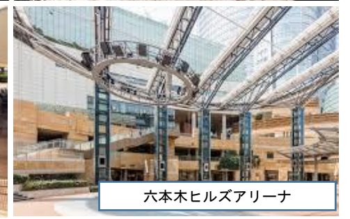
六本木ヒルズアリーナ