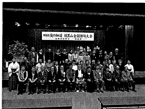
第58回奥の細道羽黒山全国俳句大会②