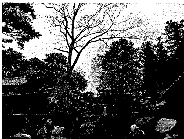
羽黒山歴史探訪【下町】八日町～池ノ仲周辺