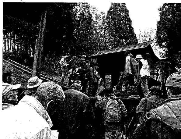
羽黒山歴史探訪【上町】桜小路周辺