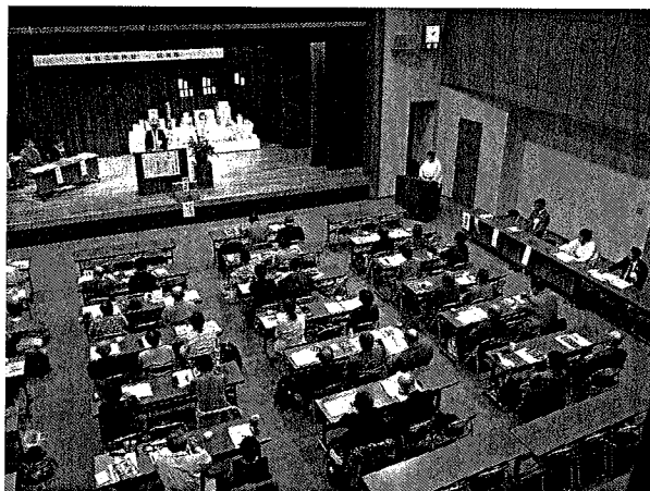
第58回奥の細道羽黒山全国俳句大会①