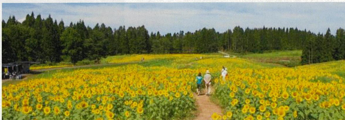
月山高原ひまわり畑

月山高原は近隣にない雄大な景観を楽しむことができるエリアであり、月山高原ハーモニーパークを通る市道と県道月山公園線が叶宮橋でつながり、このエリアを經由して月山に至る観光客が増加しています。アクセス環境の良さを産業振興に生かしていくため、民間活力を活用しながら月山高原ハーモニーパークを再整備していきます。