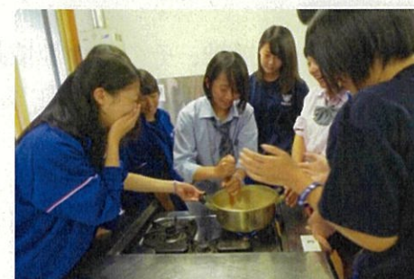
高校生による胡麻豆腐作り体験

出羽三山信仰と門前町に息づく精神文化やまちなみ景観を歴史資源のひとつとして発信するとともに、まち歩き等によりその魅力を伝えることができるように、インバウンド対応を含めた受入環境の充実を図ります。