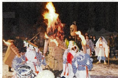
松例祭 火の打替神事

※ 松例祭大松明行事(しょうれいさいおおたいまつぎょうじ) 大晦日から元旦にかけて夜を徹して行われる羽黒山の代表的な火祭り。2014(平成26)年3月に国の重要無形民俗文化財に指定。松例祭は大晦日の昼頃から元旦未明にかけて合祭殿内や鏡池前広場などで、鳥跳び、国分神事など様々な神事が行われる。