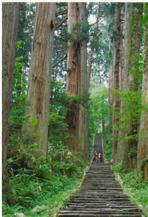
羽黒山杉並木と石段

フランスのタイヤメーカーであるミシュランが発行する旅行ガイドで、多くの国々の旅行者たちが日本各地の魅力を体験できるような情報を掲載している。