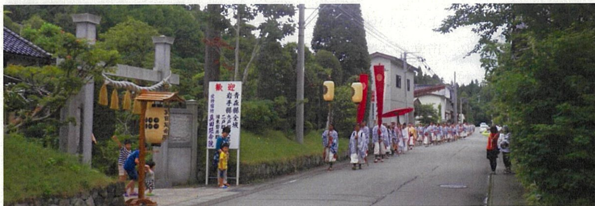
門前町手向地区固有の厳かな歴史的なまちなみ

羽黒地域は、山岳修験の霊場として広く信仰を集める月山・羽黒山・湯殿山からなる出羽三山の麓に位置し、先人から伝統と文化を継承しつつ、観光と農業を守り発展してきた農村地域です。