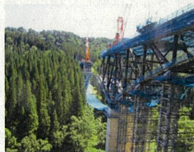
建設中の羽黒山橋(仮称)