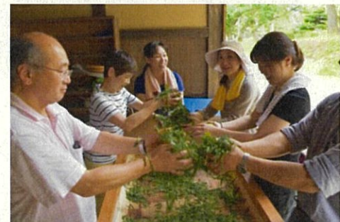
松ヶ岡茶復興プロジェクト お茶作り体験