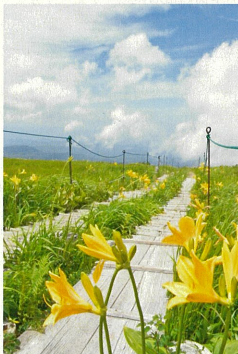
月山八合目弥陀ヶ原