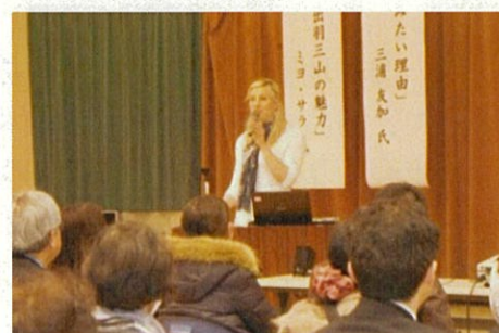
出羽三山魅力発信講演会

また、羽黒山中興の祖天宥別当の縁による東京都新島村との交流を推進し、歴史的なつながりを子どもたちに伝え、友好のきずなを深めます。