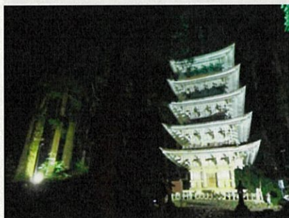
国宝羽黒山五重塔ライトアップ

このため、現在の集落の役割や活動は大切にしながらも、集落機能を補完し、防災や福祉、地域活性化を担う新たな受け皿としての自治振興会を支援することで、協働による持続可能な地域づくりを推進します。