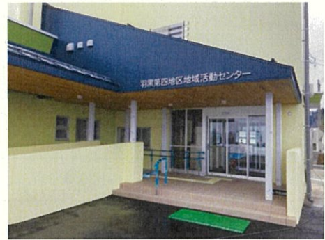
羽黒第四地区地域活動センター整備

自治振興会が管理する地域活動拠点である地域活動センター等の施設は、老朽化し利用者ニーズに対応していないことから、耐震化や長寿命化、使いやすさの向上などの改修を図り、安全かつ地域住民が愛着をもって長く使い続けることのできる施設をめざします。