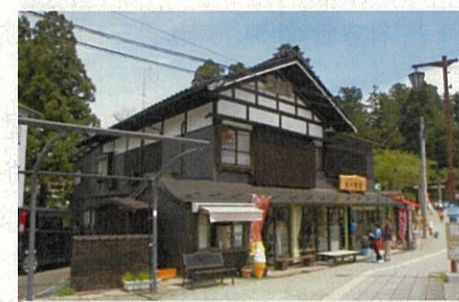
まちなみ景観保全修景整備

門前町のまちなみを保全して風致を維持し、歴史と現代生活が同居するまちなみの魅力を向上させるため、「鶴岡市歴史的風致維持向上計画」に基づき、住民が実施する修景整備を支援するとともに、良好なまちなみ景観の妨げとなる要素を解消するための取組を進めます。また、道路美装化、無電線化等の整備の検討を進めます。