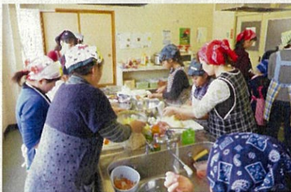
生涯学習「親子クッキング」