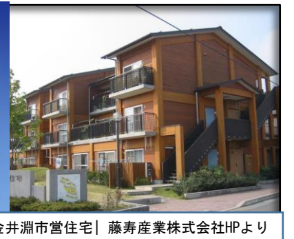
金井淵市営住宅