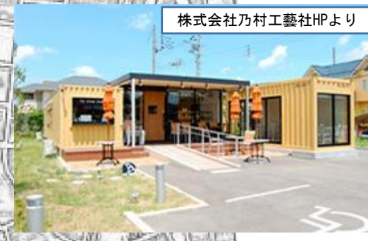
株式会社乃村工芸社HPより