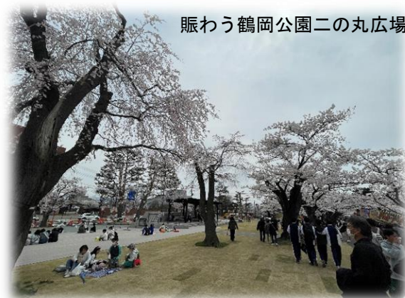
賑わう鶴岡公園二の丸広場

ビジョンを実現する 5年間のアクションプラン として 「中心市街地活性化基本計画(第3期)」 を策定【令和6年度】