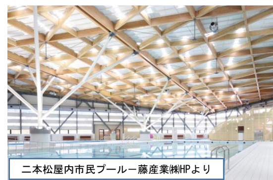
二本松屋内市民プール-藤産業(株)HPより