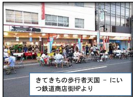
きてきちの歩行者天国 - にいつ鉄道商店街HPより