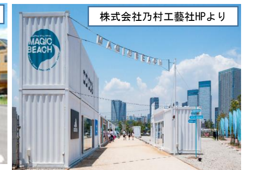
株式会社乃村工芸社HPより