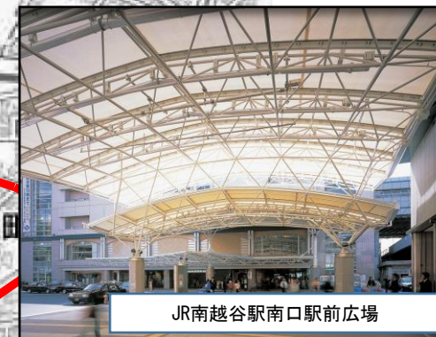
JR南越谷駅南口駅前広場