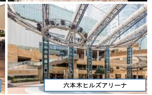
六本木ヒルズアリーナ