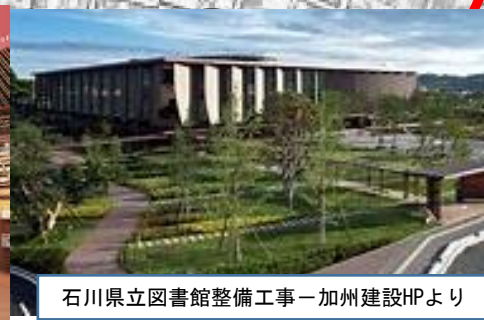
石川県立図書館整備工事