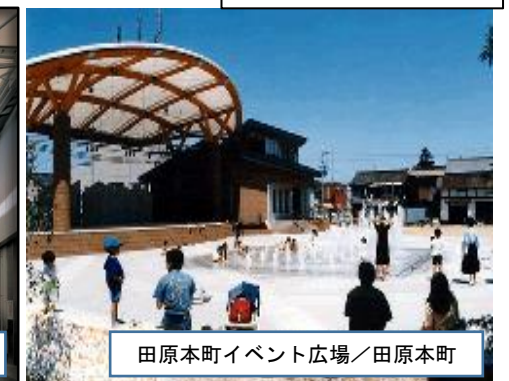
田原本町イベント広場/田原本町