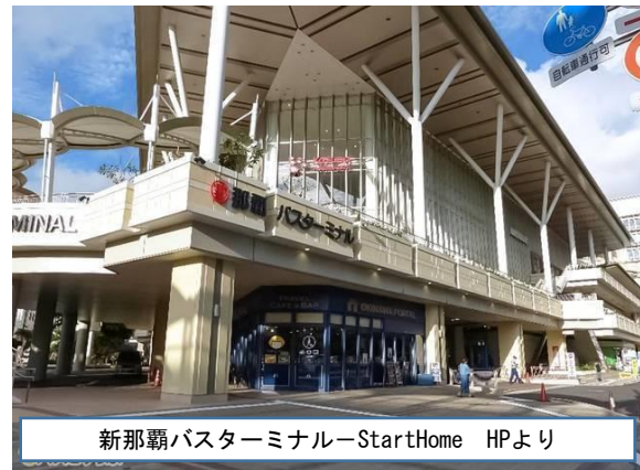
新那覇バスターミナル