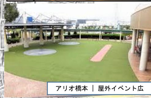
アリオ橋本 | 屋外イベント広