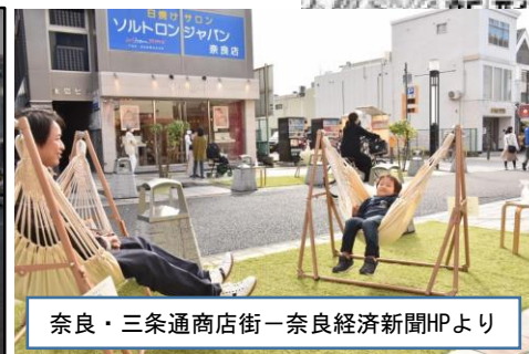
奈良・三条通商店街