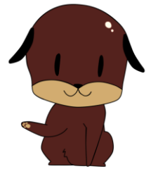
あさひむら観光協会 イメージキャラクター 「とちのみ君」