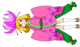
あさひから観光協会 イメージキャラクター 「カタクリ姫」

・記載の時刻は平日のダイヤであり、土曜日、日曜、祝日は運休ダイヤが異なります。通過時刻は交通事情により前後する場合があります。あらかじめご了承ください。