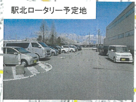
駅北ロータリー予定地