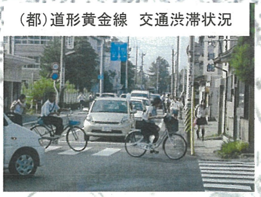
(都)道形黄金線 交通渋滞状況