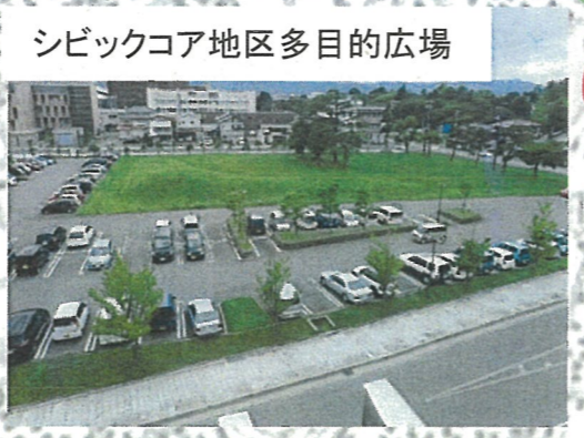
シビックコア地区多目的広場