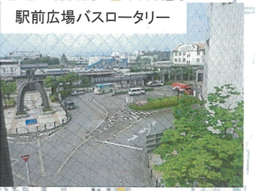
駅前広場バスロータリー