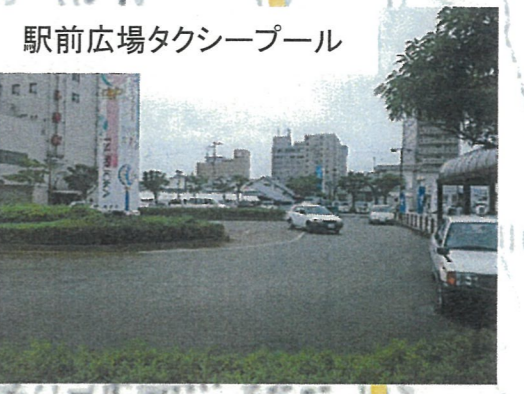
駅前広場タクシープール

暮らしやすい(クオリティ・オブ・ライフ)=歩いて暮らせるまちづくり 空き地 × 駐車場 × 公共交通 × 高齢化