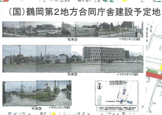
(国)鶴岡第2地方合同庁舎建設予定地