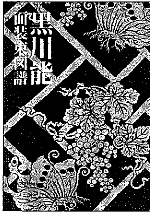
表紙はイメージです この冊子は平成24年度 日本郵便の 年賀寄附金の助成を受けて制作しました。

装束写真／紅地蜀江文黄緞狩衣、白地草花海賦文辻ヶ花染肩裾小袖 藍紅紋紗地太極図印金狩衣(いずれも国指定重要文化財) 県指定有形文化財21領を含む110点 面写真／能面 翁・尉・鬼神・男・女・怨霊・妖精、狂言面、古面など102点 特別寄稿／馬場あき子氏(歌人)、増田正造氏(武蔵野大学名誉教授、能楽研究者) 面・装束解説／大塚亮治氏、工藤幸治氏、面打系図ほか A4版・上製本・172頁・オールカラー(予定)