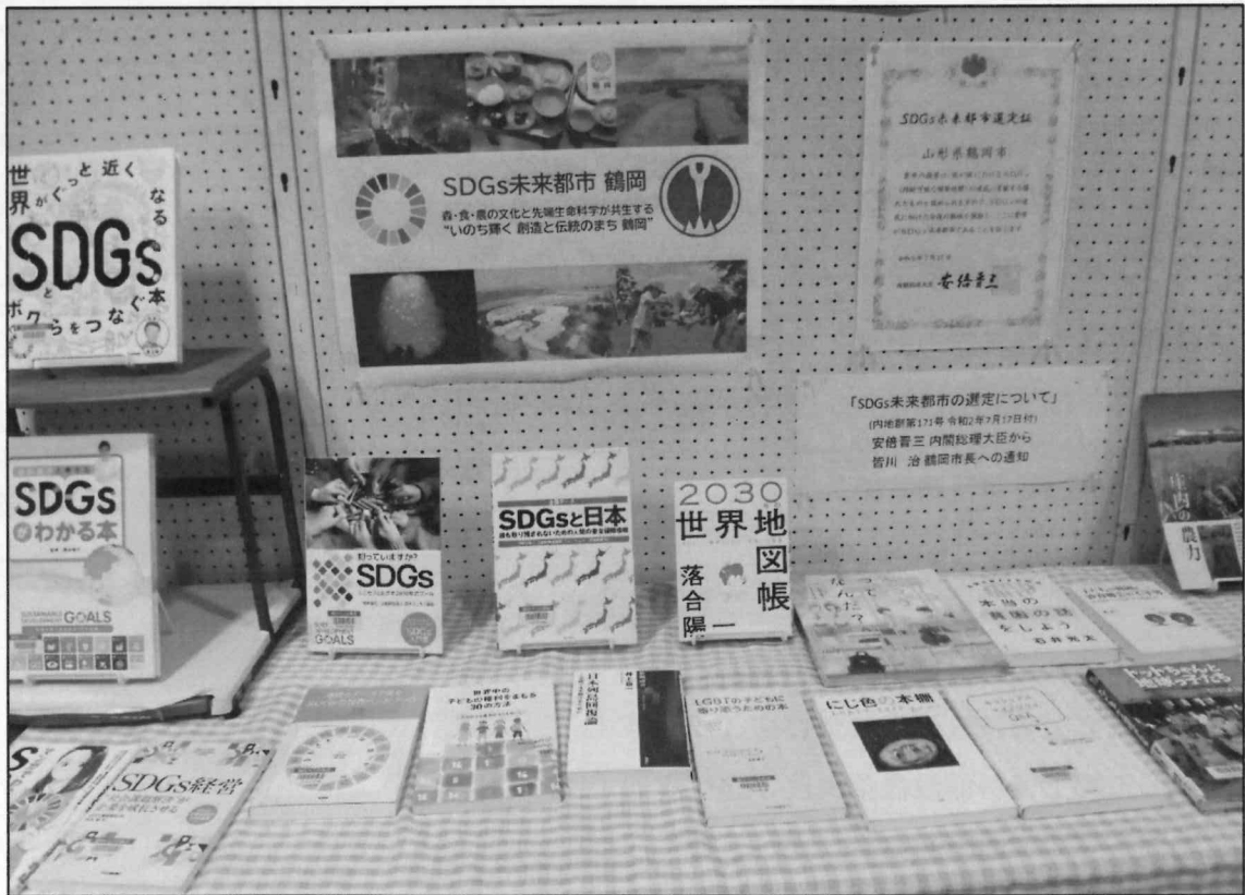
本館企画展示「鶴岡市 SDGs 未来都市選定」記念