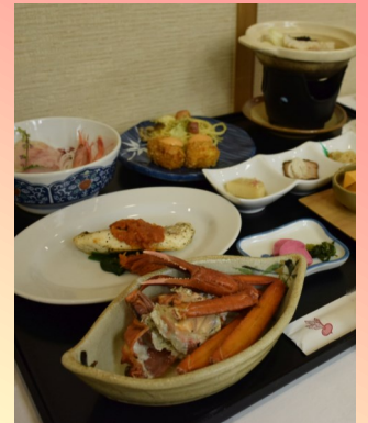
※料理写真はイメージです