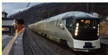
12月8日、試運転で温海にきました

「上野発の夜行列車」ならぬ「上野発の豪華寝台列車」が今年5月から運行を開始し、あつみ温泉駅に停車します！その名は「トランスイート四季島」。コンセプトは「深遊探訪」、定員34名、3泊4日の料金はお一人様75万円～95万円。高額ですが大人気で、11月までの運行分の受付は終了しております。あつみ温泉には4日目の朝に到着し、乗客は温泉街での朝風呂としな織見学等を楽しむ計画になっており、地元でも全国に向けてPRする絶好の機会として盛り上がっています。来年度のふるさと通信で運行状況をお伝えしたいと思いますのでご期待ください。【鶴岡市温海庁舎総務企画課専門員 五十嵐崇】