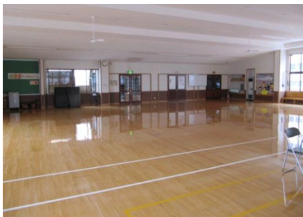
▲ホール北側（フリースペース）