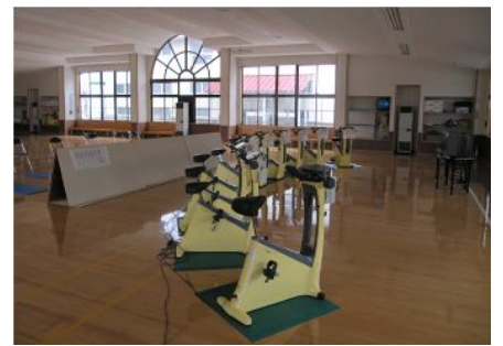
▲ホール南側（エアロバイク）

・ホールの北側は、軽スポーツが行えるほか、芸術趣味団体が工芸品などを制作できるフリースペースとなっています。広さはだいたいバウンドテニス2面分の広さとなっています。