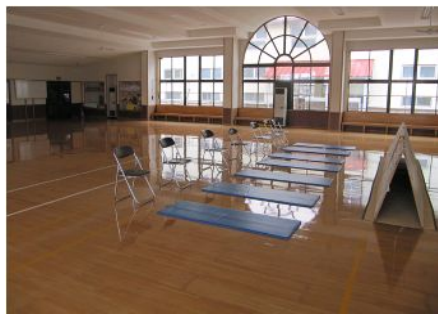
▲ホール中央（ストレッチマット）