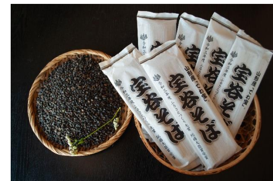
新商品「乾麺」販売開始